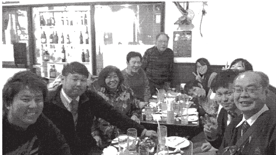
ダスキンコペル新年会

「ラウズ型吸塵吸水マット」これは便利ですよ！自宅マンションの掃除の回数も減り楽になりましたし、4.7mmの薄さなので、ドアの開閉にも引っかけません。また、カラーを変えて楽しんでいきます。