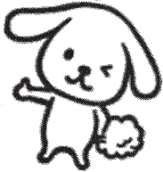
ダスクン(ダスケン)