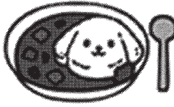
ダスクン(ダスケン)