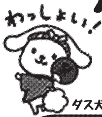
ダスクン(ダスクン)